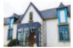
Club Jeanne d'Arc

le 18 septembre. Départ de Bodilis à 9h45. Visite guidée du musée de la Marine - Déjeuner au restaurant et sortie découverte en bateau de la Rade de Brest. Inscription auprès des membres du bureau du club ou à bpt17@aliceadsl.fr